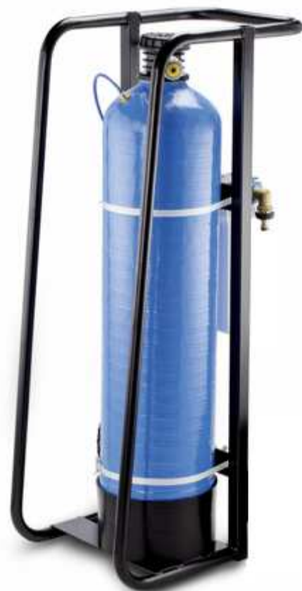
Station mobile 25 litres pour le remplissage complet d'une installation